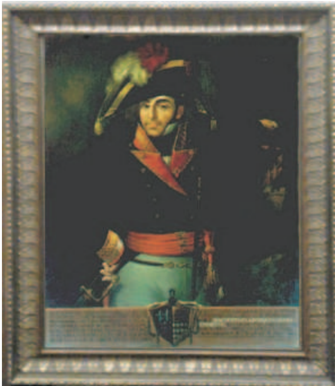
8. Cuadro del general Menacho que preside la Sala de Juntas del Cuartel General de la Brigada Extremadura XI.

Se levanta en el kilómetro 20 de la carretera de San Vicente de Alcántara. Dispone de instalaciones para albergar, alimentar, abastecer y atender sanitariamente a cerca