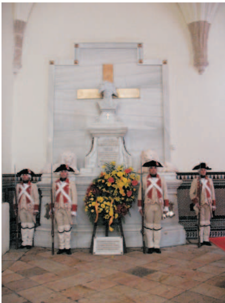
7. Mausoleo de Menacho con guardia de honor del Regimiento Castilla 16 en el Bicentenario de su muerte en combate (4 de marzo de 2011).

e institutos civiles y militares. Cerraban la comitiva un batallón de infantería, del Regimiento Gravelinas n.º 41 y un escuadrón de caballería del Regimiento de Cazadores de Villarrobledo n.º 23.