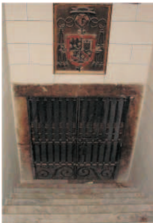
5. Cripta de Canónigos de la Catedral de Badajoz donde reposaron los restos de Menacho durante 69 años.

Sí podemos anotar que, en 1908, la Comisión provincial de Monumentos negó al Gobernador Militar de la plaza, el general José Macón, la cesión temporal de los