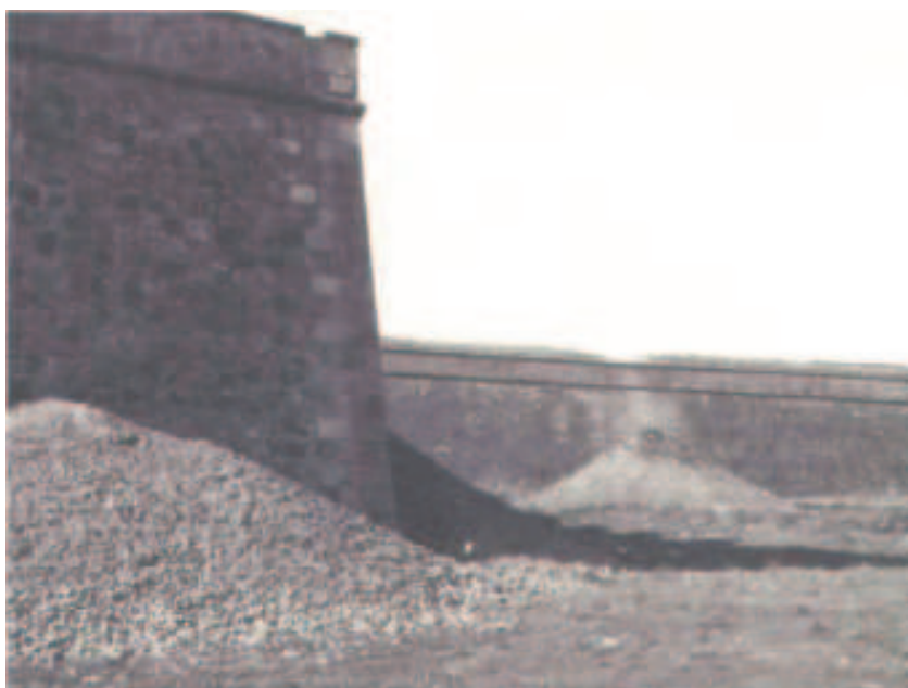
2. Baluarte de Santiago y tramo de cortina de la muralla donde estaban abriendo brecha los franceses en marzo de 1811.

La lógica reacción de los franceses es procurar romper la cadena de mando, las comunicaciones, y las punterías de las piezas establecidas como apoyo a la misión 5 .