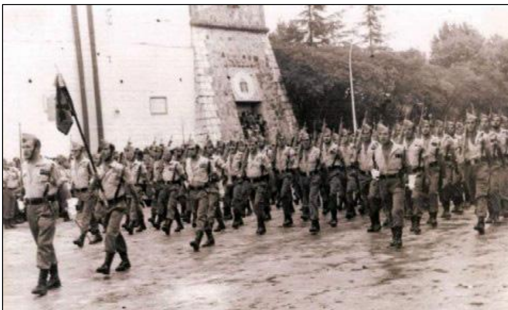
La Legión desfilando por Puerta Trinidad (Badajoz)

Falleció en Badajoz, el 2 de septiembre de 1984, a los 78 años de edad.