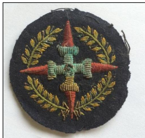
Distintivo de brazo de Laureada Colectiva

El día 5 de mayo marcha con la Bandera a la orilla del río Segre donde queda prestando servicios de seguridad. En virtud de D.C. de fecha 8 de junio, D.O. 597 se le concede el uso del distintivo de la Cruz Laureada de San Fernando Colectiva, por haber tomado parte con su Unidad en las operaciones realizadas en la Ciudad Universitaria (Madrid), durante los días 15 de noviembre de 1936 al 10 de mayo de 1937.