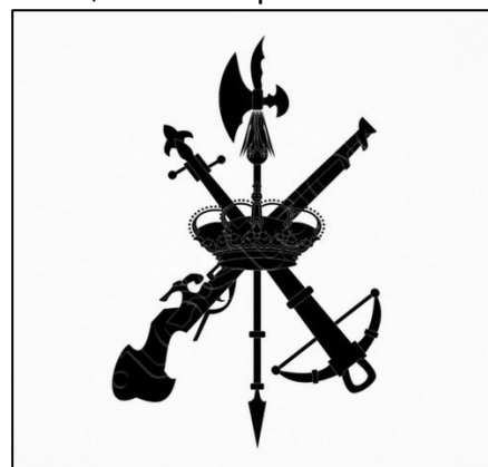
Emblema del Tercio

De su anterior destino sale en camiones para Toledo desde donde continúa el día 12 a Los Cigarrales donde permanece de servicios hasta el 6 de julio que marcha a Toledo, donde queda de servicios de campaña.