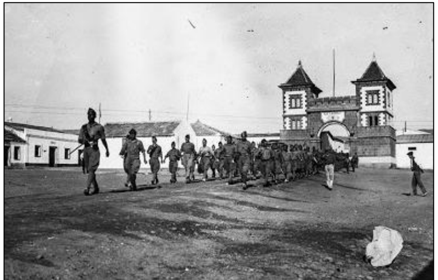
Cuartel de Dar Riffien

En dichas playas, casi salvajes, entre peces y cangrejos, tortugas, aves de gran colorido y una gran cantidad de riachuelos que iban a verter sus aguas al mar, una serie de niños españoles y marroquíes éramos libres. La playa era nuestra, mejor dicho, estaba acotada por La Legión, pero ésta permitía que los hijos de sus militares pudieran disfrutar de ella.