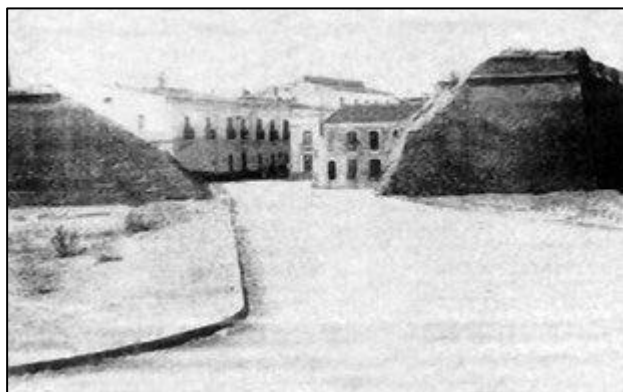
Brecha de la Trinidad, Badajoz 1936

De esta ciudad parte el día 2 de agosto formando parte de la columna que manda el teniente coronel don Carlos Asensio Cabanillas, con dirección a Badajoz, ocupando a su paso los pueblos de Santa Olalla, Monesterio, Fuente de Cantos y Los Santos de Maimona, después de sostener duros combates en la ocupación de este pueblo, continuando el día 7 y ocupando Almendralejo, después de gran resistencia por parte del enemigo, como igualmente los de Alange y la Zarza, continuando a Mérida, donde queda hasta el día 13 que de nuevo prosigue el avance. Ocupa Talavera la Real, siguiendo hasta llegar al barrio de San Roque, donde después de resistir el tiroteo del enemigo, logra ocuparlo y queda en dicho barrio hasta el siguiente día que en las primeras horas inicia el asalto a la ciudad por la derecha de la Trinidad, sosteniendo fuertes combates con el enemigo, resultando herido en este día por fuego enemigo, siendo evacuado al Hospital de Cáceres en el que permanece en curación de sus heridas, hasta el día 20 que es evacuado al de Badajoz.