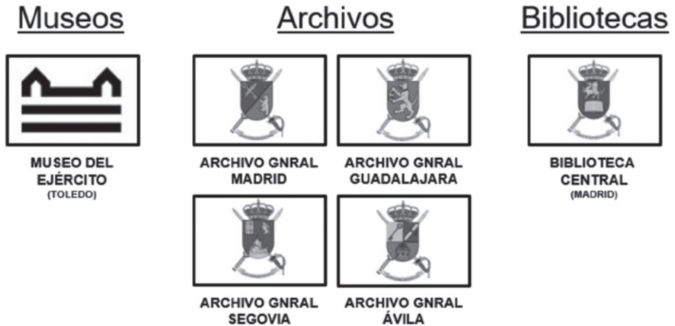
Lám. 3. Establecimientos centrales del IHCM.

Una medida pionera que demuestra el esfuerzo por recopilar el patrimonio bibliográfico militar y que permitirá que la Biblioteca Central Militar se consolidara como la mayor biblioteca del Ejército.