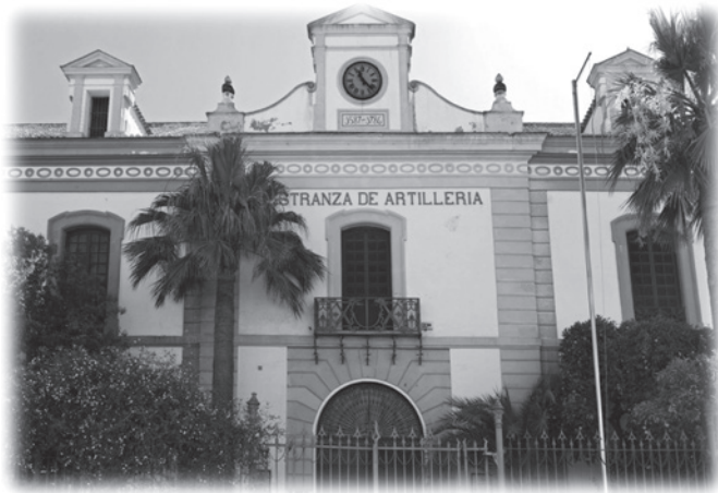
Lám. 1. Primera sede de la Biblioteca Militar de Sevilla (Maestranza de Artillería).

Aunque en la época actual de las comunicaciones digitales e Internet puede parecer una institución obsoleta, nada más lejos de la realidad. Dar a conocer su potencial y las posibilidades que ofrece a investigadores y aficionados a la Historia Militar es el objeto de este artículo.