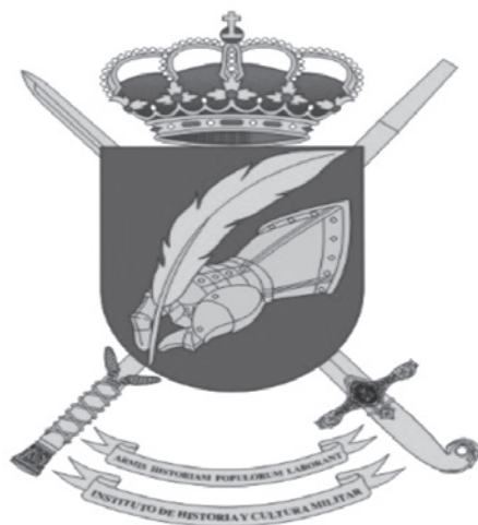
Lám. 2. Instituto de Historia y Cultura Militar.