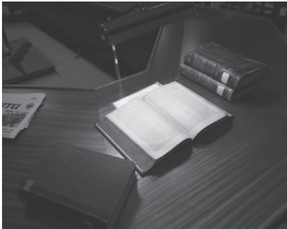
Lám. 9. Puesto de lectura.