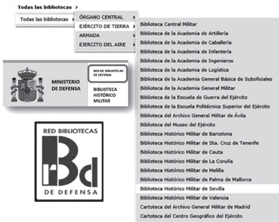
Lám. 6. RBD. Subred del Ejército de Tierra.

La Red de Bibliotecas de Defensa (RBD) es el conjunto de centros bibliotecarios, órganos de dirección y gestión y medios instrumentales que tiene como fin principal la conservación, difusión y acceso al patrimonio bibliográfico de Defensa, así como garantizar su mejor aprovechamiento mediante la cooperación y coordinación entre sus diversos elementos.