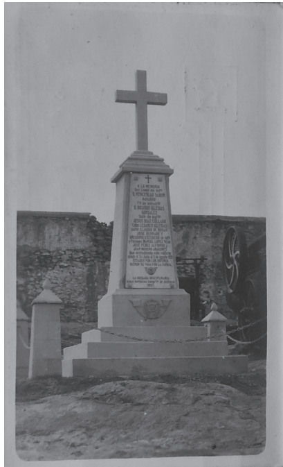
Lámina 1. A los defensores de la Fábrica de Harina, Nador 1922, colección familiar 001