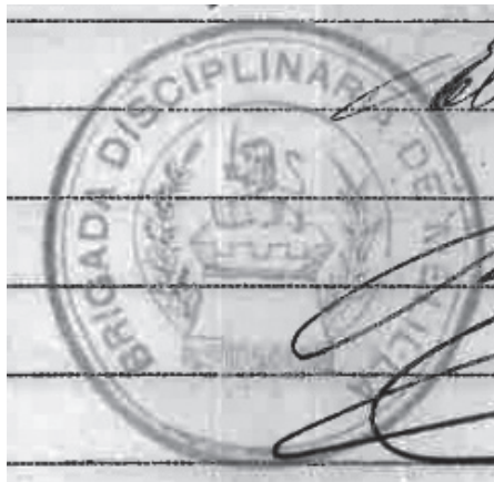
Lámina 2. Brigada Disciplinaria de Melilla 1922