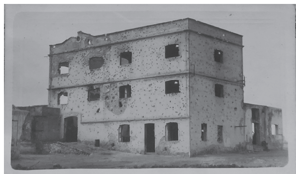
Lámina 5. Fábrica de Harina, Nador 1921, colecc familiar 001